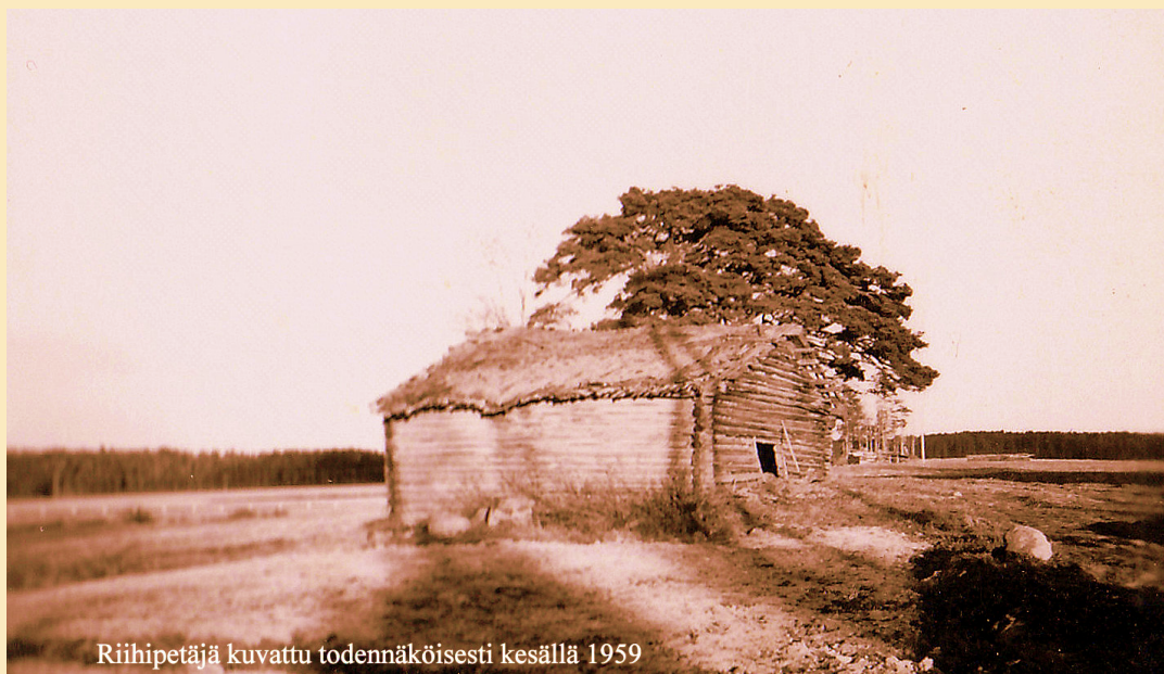
Riihipetäjä kuvattu todennäköisesti kesällä 1959