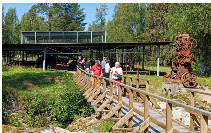
Opastuskierroksella Möhkön ruukkialueella.