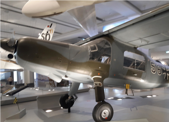
Münchenin Mercedes-Benz - museon tiloista löytyi halli täynnä vanhoja lentokoneita.