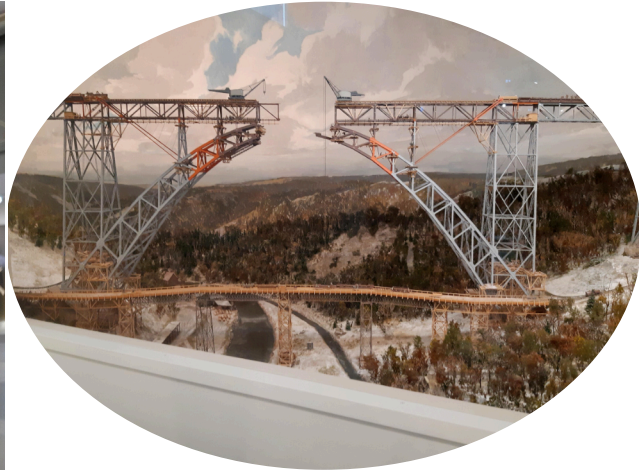
Pienoismallit olivat taidolla tehtyjä. Tässä vuosina 1893–1897 valmistuneen Wuppertalin sillan yksi kriittisistä tekovaiheista.

ja tuotannon laajuus sekä myös musiikin laaja-alaisuus, mutta varmasti myös Mozartin koko elämänkaari jyrkkine ja traagisine käännteineen. Jälkipolvien mielenkiintoa hänessä herättävät ensin nousu neljävuotiaana lapsinerona kuuluisuuteen, pääsy hovin suosioon ja rikastuminen, ja sen jälkeen yhtä nopea alamäki ja kuolema vain 35-vuotiaana, rutiköyhänä ja nimettömänä joukkohautaan haudattuna. Niinpä Salzburgin tutustumiskohteista yksi suosituimmista onkin Salzburgin vanhassa kaupungissa sijaitseva Wolfgang Amadeus Mozartin syntymäkoti.