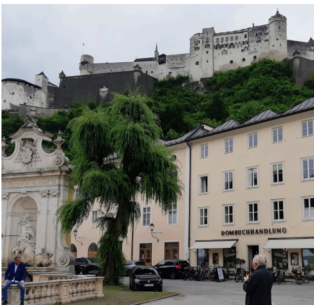
Salzburgin linna Itävallassa.

Toisen maailmansodan loppuvaiheissa liittoutuneet pommittivat Obersalzbergiä niin, että natsien huppeasta lomakylästä ei enää ole jäljellä kuin Kotkanpesä ja yksi pystyyn jäänyt rakennus, entinen hevostalli, joka toimii nyt golfklubina.