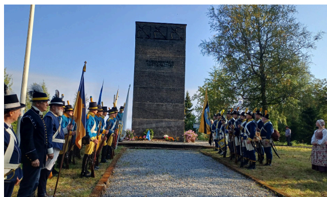
Parkunmäen taistelussa kaatuneiden sotilaiden muistohetki Parkunmäen taistelun muistomerkillä Rantasalmella