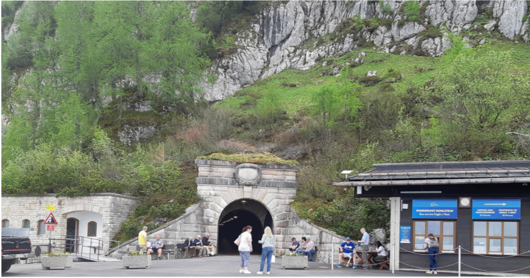
Vuoren huipulle Kotkanpesään johtavan tunnelin suuaukko.

Pääasiassa Helsingin taksiautoilijoista koostuva ryhmämme teki vuonna 2023 sotahistoriallisen matkan Viroon teemalla Suomalaiset Viron taistelukentillä. Vuoden 2024 matkalla kuljimme Suomalaisten jääkäreiden jalanjäljissä Virossa ja Latviassa. Tämä vuoden 2025 matka kulkee edelleen sotahistorianimikkeen alla huolimatta siitä, että matkasta vain osa keskittyi sotahistoriaan. Ja tekisi mieli sanoa: Luojalle kiitos! Siinäkin pienessä osassa suomalaisilla oli vain marginaalinen osuus. Tarinassa selviää, miksi näin.