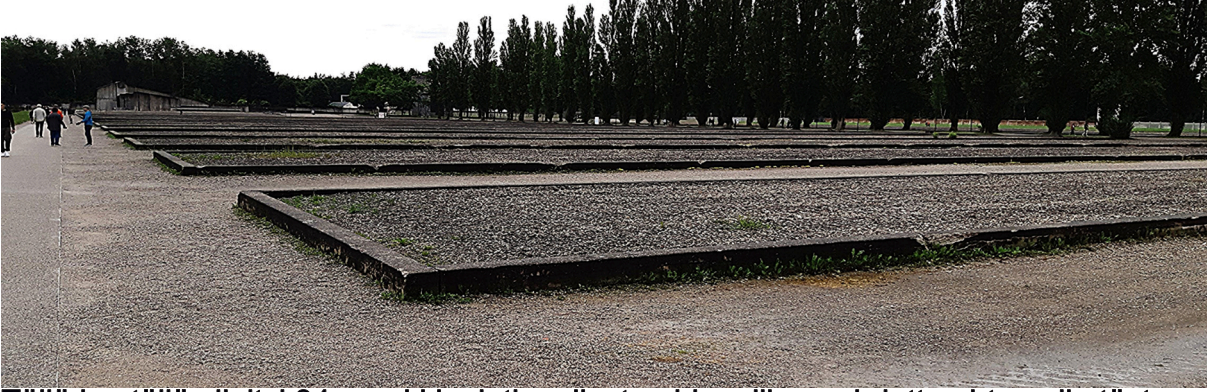
Tällä kentällä sijaitsi 34 parakkia, jotka olivat pahimmillaan ahdettu ahtamalla täyteen.