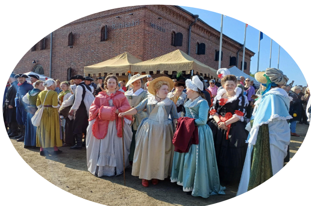
Sociéte Helsinki – Herrasväki ja Hyvät Aukkaat ry:n jäseniä 1700-luvun loppupuolen ylhäisön juhla-vaatteissa.