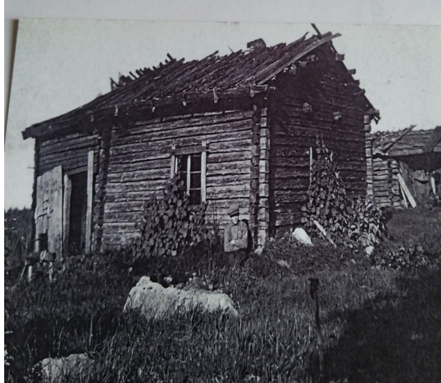
Kuva 2. Tässä savutorpassa asui neljä aikuista ja viisi lasta.

Kun Ruuskanen - Ruuska sukuseuran vuotuisen kesätapaaminen lähestyi, mietitytti, ketään meitä taas siellä on ja mihin sukuhaaraan tavatut sukulaiset kuuluvat.