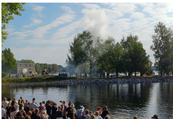
1700-luvun univormuihin ja aseisiin varustautuneiden sotilaiden taistelunäytös Tallisaassa ja Riihisaassa Olavinlinnan vieressä.