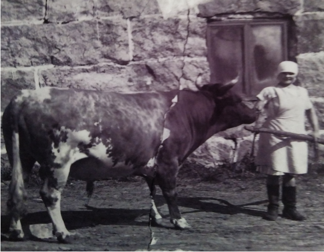
Kuva 3. Elma karjakkona; revin kuvan pienenä, kun pelkäsin sonnina.