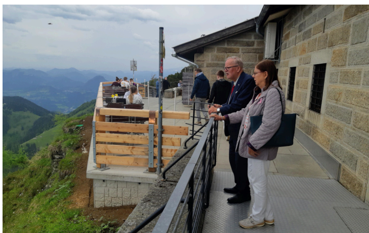
Hitlerille rakennettu peileillä vuorattu hissi (vas.). Hissillä pääsee 1834 metrin korkeudella olevalle patiolle, josta aukeaa komea maisema ympäröiville Alpeille (oik.)