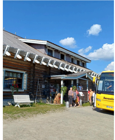
Karjalainen pitopöytälounas Ilomantsin Parpeinpirtillä.

Ruuskanen-Ruuska sukukokous ja -tapaaminen pidettiin Joensuussa lauantaina 26.7.2025. Tavoitteena on ollut järjestää näitä tapaamisia seudulla, jossa Ruuskanen-Ruuska-suvun jäsenet ovat asuneet ja jotenkin historian saatossa vaikuttaneet.