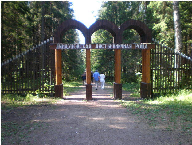
Portti tsaarin lehtikuusimetsään