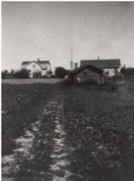
Rannasta päin katsottuna Olli sedän kesä huvila vasemmalla ,Tuomaan talo oikealla, edessä sauna rakennus.

- Tuttu kuva jo lapsuudestani lähtien ... isäni setien talot