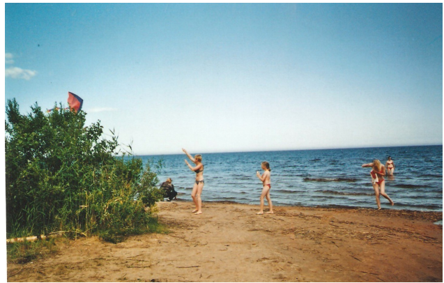
Laatokan rannalla lapset leikkivät ja lennättivät leijoja.

suunnan. Laatokan rannalla juotiin kahvit. Monet kävivät uimassa. Myös venäläiset olivat löytäneet rannan ja lapset olivat innoissaan. Monien peltoaukeamien välissä kulkevat kuoppaiset tiet oli reunustettu valtavilla monen metrin korkuisilla kukassa olevilla väinönputkilla. Bussien kuljettajat väänsivät ankarasti rattia pitääkseen bussit huonoilla osuuksilla tiellä. Päästiin kuitenkin yöksi seuraavaan majapaikkaan Lesovoon Vuoksen rannalle.