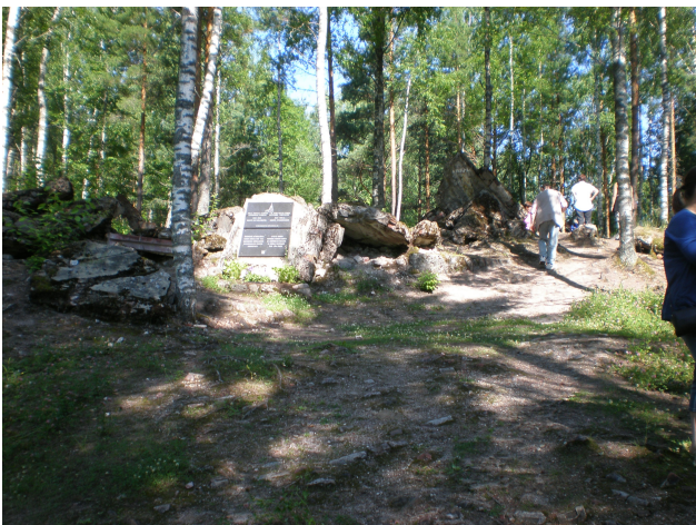
Äyräpään kirkko sijaitsi tällä paikalla

”4.7. Aamulla lähdettiin Lesovosta, joka oli aikanaan Kiviniemi. Käytiin Kiviniemessä talvisodan muistomerkillä. Muistomerkiksi voi kutsua myös puustoa, joka oli tykistökeskityksissä kaadettu maan tasalle. Jäljellä oli vain nuorta puustoa. Matkaa jatkettiin Viipuriin. Käveltiin torilla ja kirkkopuistossa. Pyöreässä tornissa juotiin kahvit. Paluumatkalla eräs matkalainen kertoi alueen kasvillisuudesta ja kasveista, joita hän oli löytänyt paikoista, joissa on käynyt. Joukossa on ollut myös harvinaisuuksia.”