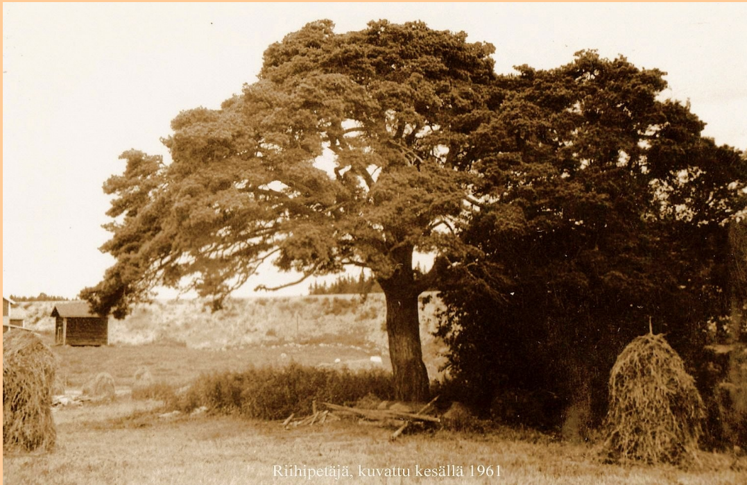
Riihipetäjä, kuvattu kesällä 1961

Ruuskanen-Ruuska sukuseuran sukuviesti 25 helmikuu 2015