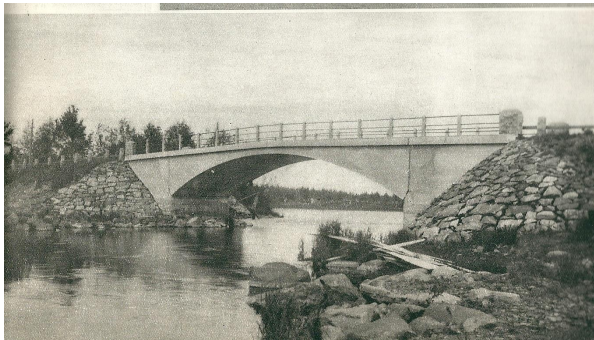
Vanhempieni rakentama omakotitalo oli tämän Pärnän sillan kupeessa. Talo tuhoutui samalla, kun vihollinen pommitti siltaa.