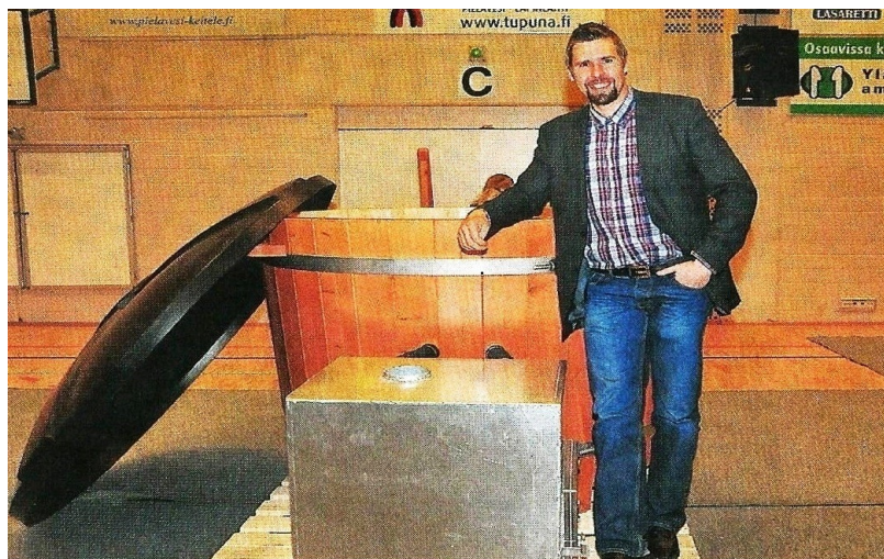
Kunta lahjoetti Antille Piellavveen ennätuksesta kommeen palajun.