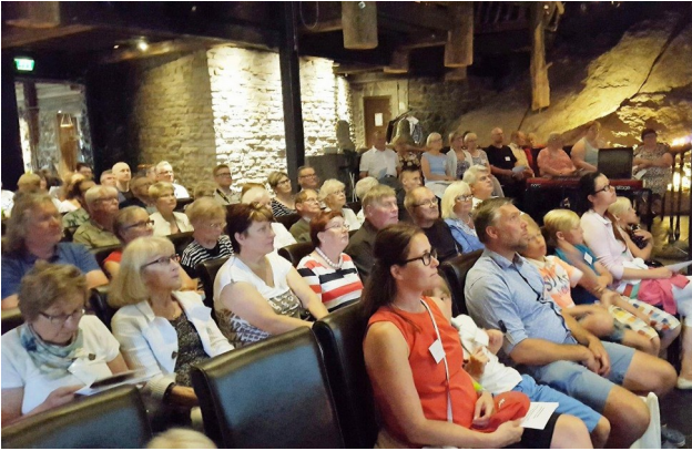
Kokousyleisöä