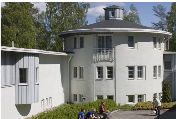
1967 asuntolaksi valmistunut Pyöreä Tornii.

tai Seppo Ruuskanen 0400-770323 seppoj.ruuskanen(at)phnet.fi