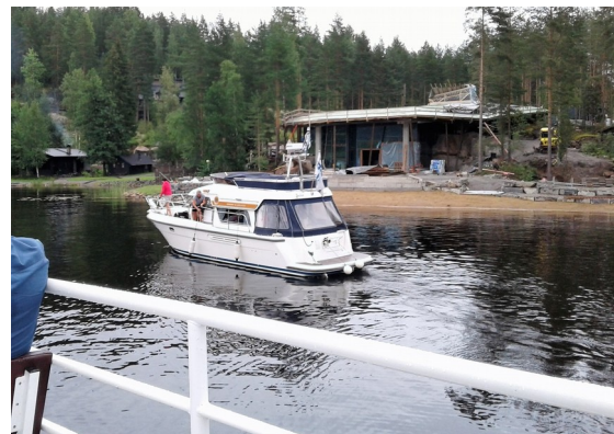
KUVA 4. Haukiveden maisemia Järvi-sydämen sataman tuntumassa

Virallisen sukukokouksen jälkeen pääsimme odotetulle risteilylle yli satapaikkaisella Elviiralaivalla Haukiveden maisemiin (KUVA 4). Sade oli loppunut ja sää oli mitä mainioin norppienkin bongaukselle. Varmoja havaintoja ei meidän sukuhaara saanut, mutta voimme kuitenkin kehuskella poissaoleville, että saattoi siellä ollakin. Matka sujui mukavasti maisemia katsellen, tarinoiden ja tarjoilusta nauttien.