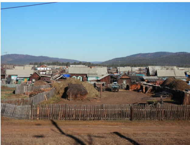
Maaseudun kylissä tontit on aidattu ja ikkunanpielet maalattu. On myös monenlaista liikennevälinettä ja työkonetta. Nämä ovat lähes poikkeuksetta sellaisia joita ihaillaan meilläpäin vanhojen laitteiden museoissa.

Matkalla huomasi, että Venäjä on todella valtavan kokoinen maa. Matkan aikana sivuutetaan 8 aikavyöhykettä. Ja ennen kuin ollaan Venäjän itäisimmässä osassa Beringin salmen rantamalla, aikavyöhykkeitä on vielä 3 lisää. Aiemmin olen ajatellut, että kun ollaan Uralilla, ollaan jo maailman ääriässä. Siperian rata antoi perspektiiviä, Ural ylitettiin ja tultiin Aasian puolelle noin vuorokausi Moskovasta lähdön jälkeen. Venäjä on myös todella harvaan asuttu maa. Saatettiin kolkutella tuntitolkulla näkemättä muuta kuin taigaa. Vastaavasti radan varrella on asutuskeskuksia, joiden määrää on vaikea kuvitella näkemättä. Matkan aikana sivuutettiin lukematon määrä kaupunkeja ja kyliä. Isompia asutuskeskuksia viidestäsadastuhannesta noin 1,5 miljoonaa asukasta käsitäviin metropoleihin radan varteen mahtuu, matkaesitteen mukaan 12 kappaletta. Näiden väkirikkaiden kaupunkien lisäksi on kymmeniä asutuskeskuksia, jotka suomalaisen mittapuun mukaan olisivat ihan liigakelpoisia paikkakuntia.