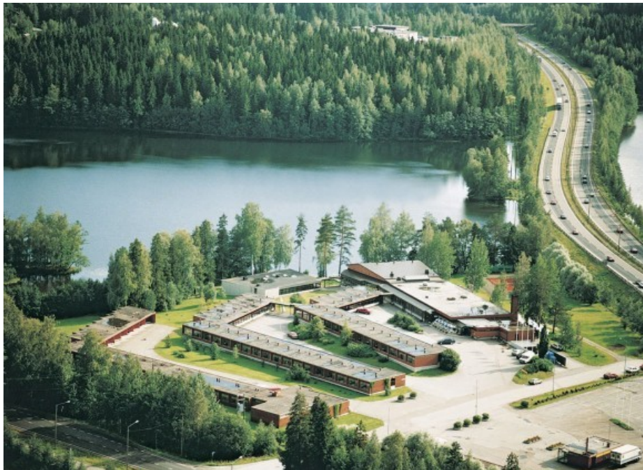
Hotelli IsoValkeinen sijaitsee n. 5 km päässä Kuopion keskustasta Iso-Valkeisen rannalla, Savon valtatie varrella.

Hotellin puhelin 017 539 6501 ja sähköposti: sales2(at)isovalkeinen.com nettisivu www.isovalkeinen.com