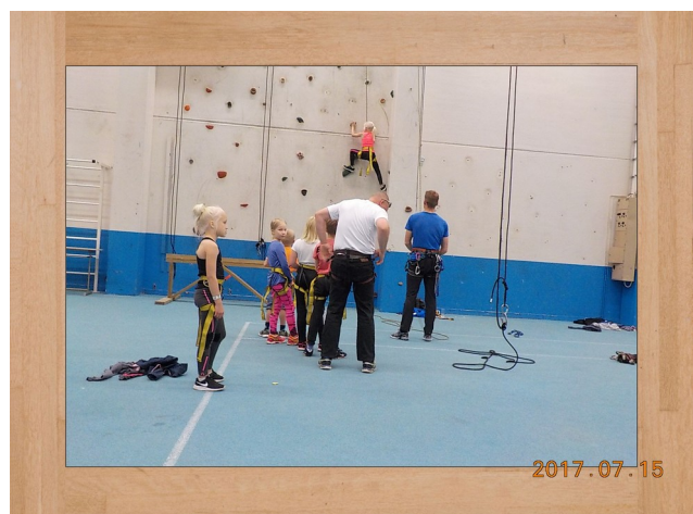
Kuva: Lasten ohjelmassa oli mm. seinäkiipeilyä