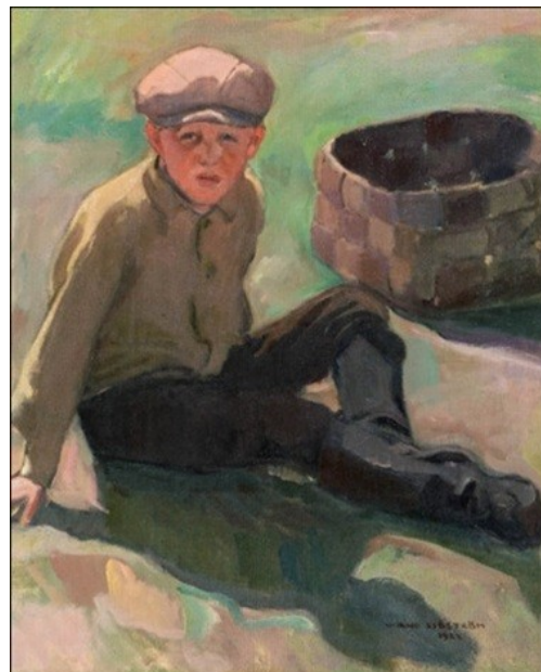
Vilho Sjöström: Huutolaispoika