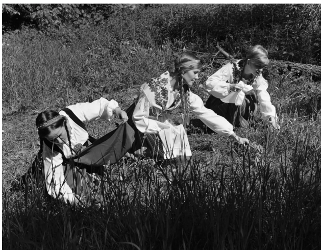
Kuvan nuoret naiset keräämässä kukkia juhannustaikojaan varten.

Vaarallisena rakkaustaikuutta pidettiin, sillä siinä käsiteltiin usein maagisesti esimerkiksi ruokaa, minkä uskottiin aiheuttavan hulluutta, jos sen kohteeksi sattuiкин väärä henkilö.