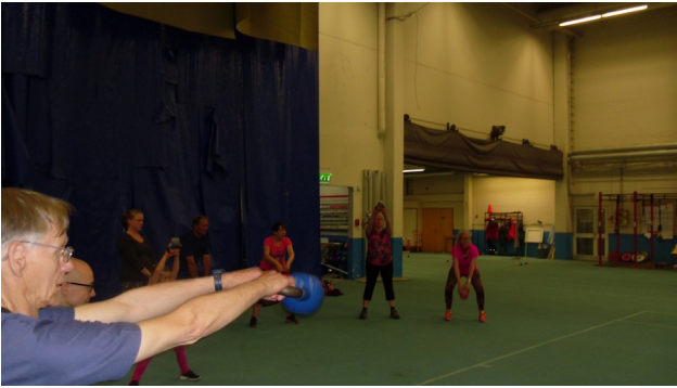
Kuva: Kahvakuulaharjoitus monitoimihallissa

asennosta nousemalla. Tämä oli kyllä tapahtuman vaativin harjoitus minun mielestäni ja siinä saatiin hikikin jo irti.