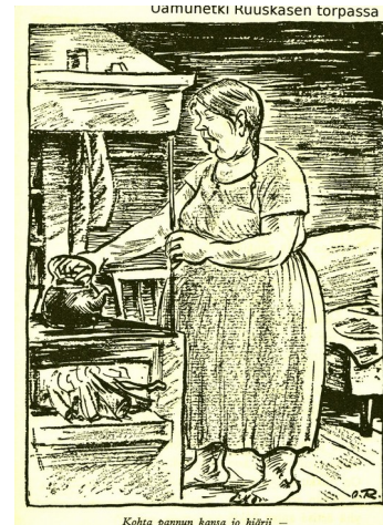
Kohta pannun kansa jo hiärii —

Alushammeesa kaalusta kuopasten sekä kumpoohii kylykeessä ruopastsen Kaesa makkeesti kerran haakottelloo, vähä sieltä, vähä tiältä vielä ruopottelloo, tukar rippeitä kokkoon kiärii. Siinä tuntoopa kahvij jannoo. Kohta pannun kansa jo hiärii sekä tulta sen alle pannoo.