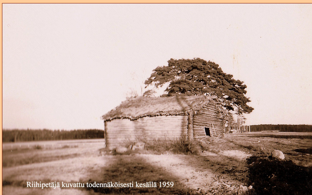
Riihipetäjä kuvattu todennäköisesti kesällä 1959

Ruuskanen-Ruuska sukuseuran sukuviesti 33 marraskuu 2017