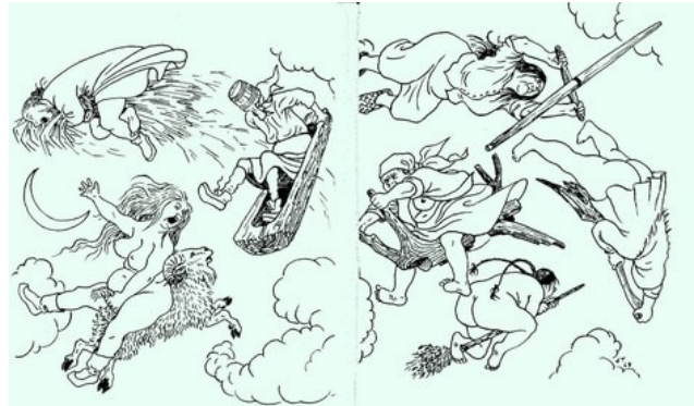
Rullit lentelemässä pääsiäisyönssä. Erkki Tantun kuvitusta Kustaa Vilkun kirjaan "Vuotuinen ajantieto".

nostettiin huhujenkin perusteella. Tällöin näyttökysymys oli vaikea ja monesti tällaiset huhuihin perustuvat jutut kaatuivat näytön puutteeseen.