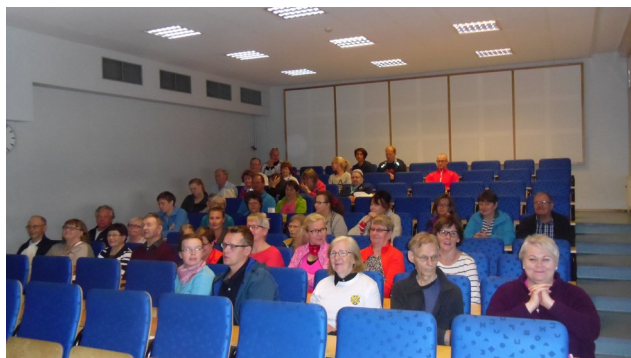
Kuva: Yhteistapaaminen auditoriossa

Paikalle saapui kaikkiaan 67 osallistujaa , joista 17 oli lapsia, mikä on todella ilahduttavan hyvä saavutus. Osa oli saapunut paikalle Savonlinnan Tanhuvaaraan jo perjantai-iltana ja majoittunut urheiluopiston tarjoamissa huoneissa.