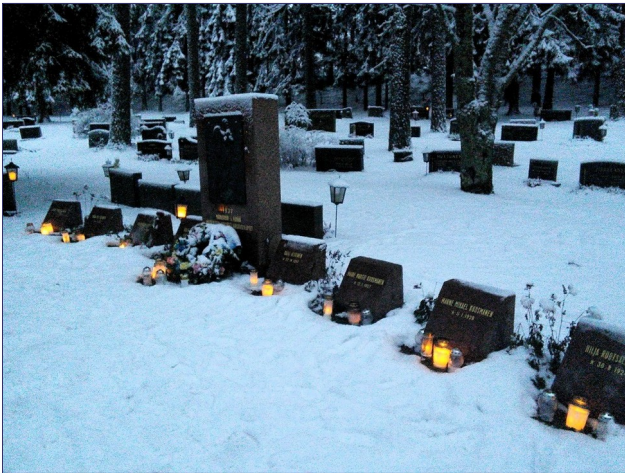
Puutelahden muistotilaisuus 25.11.2017.