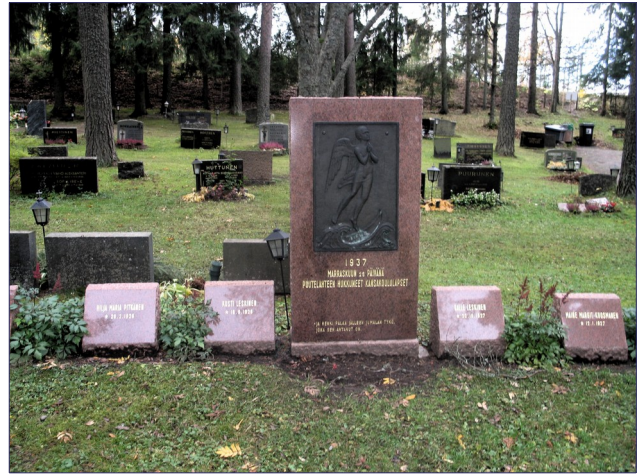
Puutelahden muistomerkki.