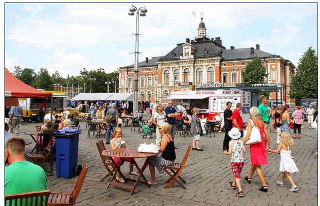
Kuopion torin kesäistä menoa.

Majoitus on varattava meille varatusta kiintiöstä 10.7. mennessä. Hotellin ilmoituksen mukaan muut huoneet on jo myyty. Varausta voi tehdä p. 017- 539 6501 ja varaus on tehtävä suoraan hotellista.