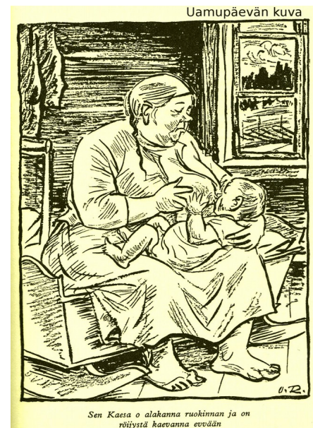
Kuva: Oki Räisäsen kuvitusta kirjaan Sanarrieskoo