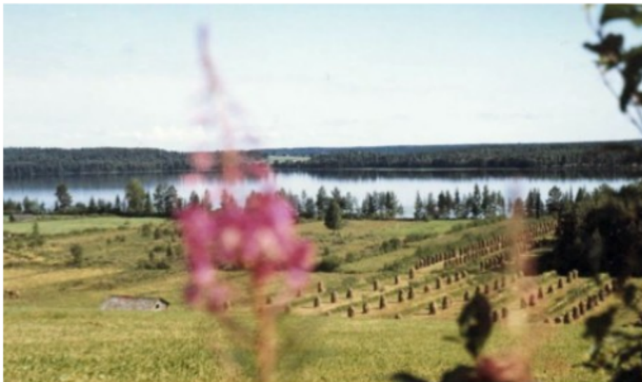
Näkymä Vestolanmäeltä Hakojävelle 60 luvulla.