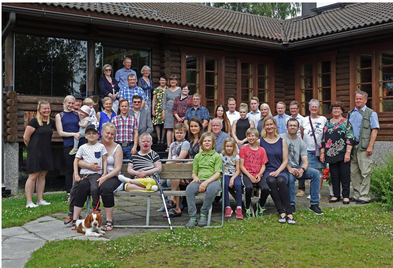
Serkkutapaaminen 7.7.2018 Heinolassa, Myllyojan Rentolassa