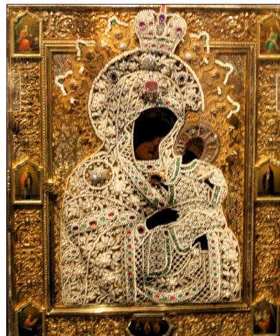
Ihmeitätekevän Konevitsan Jumalanäidin ikonin riisa, 1893, kullattua hopeaa ja jalokiviä