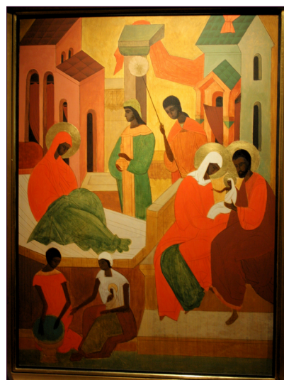
Veikko Marttinen: Neitsyt Marian syntymä, 1957, öljymaalaus kovalevyllä.