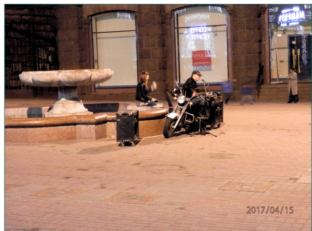
Tummaa ja uhmakasta musiikkia Maidanin yössä

Kävimme Maidanilla myös illalla. Myös silloin siellä oli runsaasti väkeä. Näkyi olevan myös erilaista ohjelmaa muiden muassa lauluryhmiä, joiden esittämä musiikki, oli hyvin tummansävyistä. Ihmiset kuuntelivat laulua kovin hartaina, joten sanomaa voi vain arvailla. Ryhmässä liikkuen ei paikan ihmisvilinässä tuntunut pahalta, mutta eittämättä yksin liikkua alkoi tuntua ”orvolta”, sen verran kiihkeitä kaupustelijat ja yleinen tunnelma oli.