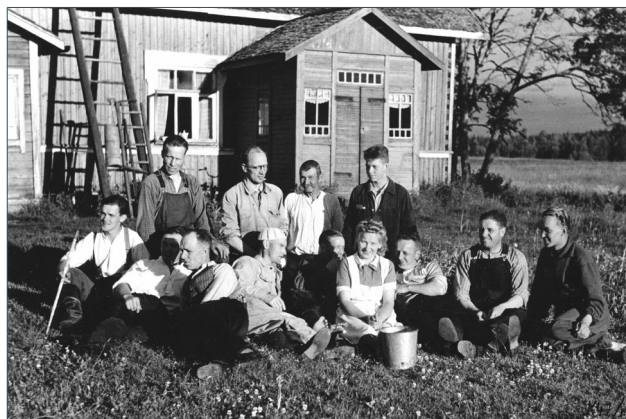
Kuvassa 1 on talkooväki joukossa isoisäni kolme setääni ja talkooporukan emäntä