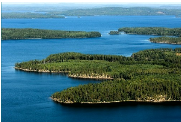
Keski-Keiteleen avaruutta.

Viime kesänä Kuopiossa pidetyssä sukukokouksessa päätimme järjestää omakustanteisen sukutapaamisen missä vapaamuotoisen ohjelman ohella tutustuttaisiin sukulaisiin ja kokoontumispaikkakuntaan.