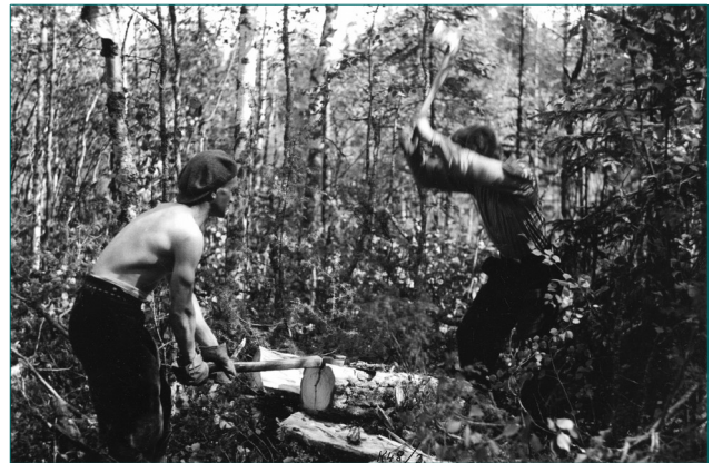
Kuvassa 4 halkeaa pölli haloiksi kahden miehen voimin.

Vanhin setäni muisteli aikanaan, että metsänomistajalle ei puista paljoa maksettu ja hän nimitti tätä polttopuunmyyntiä OTK:lle ryöstöhakkuuksi. Ensimmäisessä valokuvassa on talkooväli emäntineen kotitaloni pihamaalla. Talkoolaisia näyttää olleen kahdeksan miestä ja heidän ruokahuollosta vastannut emäntä. Muissa kuvissa on puunhakkuu käynnissä metsässämme. Kuvat on otettu heinäkuussa 1943.