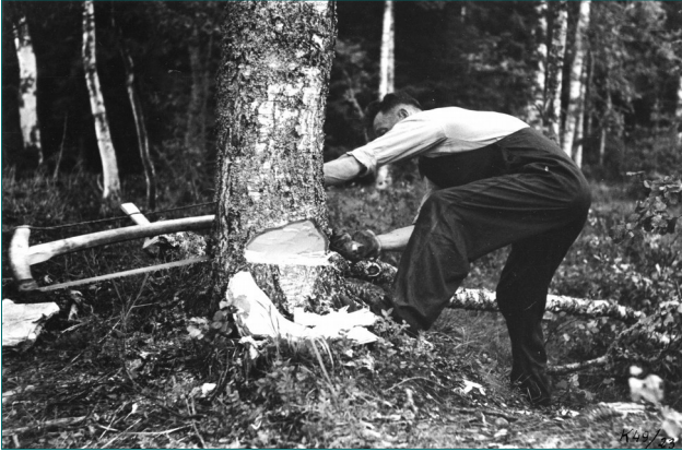
Kuvassa 3 on menossa koivunkaato pokasahalla.

Mottitalkoot-opas, jossa oli tietoa talkoolaisten oikeuksista, talkoometisen ja työvälineiden hankkimisesta, tapaturmakorvauksista, kuljetuksesta, muonituksesta sekä mottitalkoiden taloudenhoidosta. Hakkauttajan maksama työpalkkaa vastaava korvaus maksettiin lyhentämättömänä Asevelikassaan. Talkoolainen sai myös lunastaa hakkaamansa motin itselleen, mutta ei myyntiin.