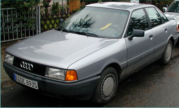
Audi 80 D

2003 - 2005 autoliikkeenkin toivat runsaasti hyviä käytettyjä autoja maahan ja tekivät niillä tiliä. Käytettyjen henkilöautojen hinnat laskivat Suomessa merkittävästi vuosikymmenen 2009 loppua lähestyttäessä ja autoliikkeiden tuonti väheni merkittävästi.