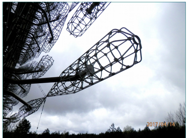
Yksi lukuisista tutka-aseman seinässä olevista vastaanottimista.

Ja toden totta, kun aluetta lähestyttiin, päätieltä rakennelmaa ei nähnyt, paitsi hetken pilkahduksen, jos osasi oikein katsoa ja tunnistaa näkemänsä. Kun päästiin paikan päälle ja jalkauduttiin, hämmästys oli melkoinen. Tyhjiä asuintaloja, joista muutama entiset asukkaat olivat palanneet, oli pitkin alueen metsiä. Tyhjiällä olevia kone- ja työhalleja sekä asuin- ja toimistorakennuksia oli useita. Mutta se antenniseinä! Muototeräksestä tehty rakennelma, jonka mitat ovat korkeus 150 leveys 120 ja kokonaispituus 750 metriä. Ja tämän rumiluksen lännen puoleisella sivulla lukematon määrä erilaisia antennejä, valmiina sieppaamaan kaiken siepattavaksi tarkoitettun.