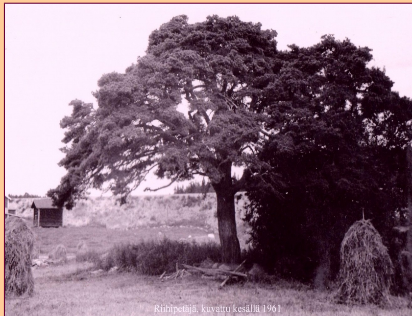
Riihipetäjä, kuvattu kesällä 1961

Ruuskanen-Ruuska sukuseuran sukuviesti 37 helmikuu 2019