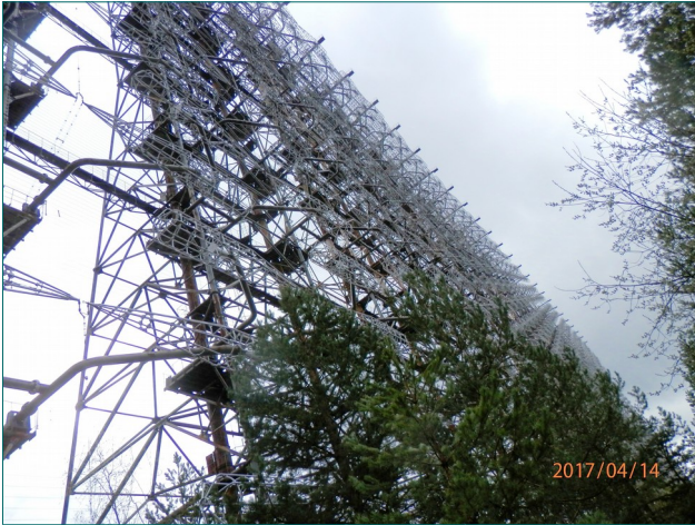
Noin 11 hehtaarin kokoista tutka-aseman ”seinää” on vaikea saada kuvatuksi. Asemaa kutsuttiin lännessä Venäläiseksi tikaksi. Nimi johtui nakuttavasta äänestä millä asema suoritti radiohäirintää.

Tämän Duga-3 nimellä kulkevan tutkajärjestelmän tarkoitus oli suojata maata lännessä tulevalta ydinhyökkäykseltä. Sen piti havaita vaara jo niin kaukaa, että oli aikaa hyökkäyksen torjumiseen. Kun reaktori räjähti, se oli vaikuttanut rakennelmaan niin, että maali kuoriutui metallin pinnasta. Käsky kävi, että paikat pitää saada pikaisesti kuntoon ja laitteet jälleen käyttöön. Uskomattomalta tuntuu, mutta niin kerrottiin, että sotilaat putsasivat lähinnä teräsharjoilla koko rakennelman ja maalasivat pensselein. Kaikki se mitä rakennelmasta raapattaessa irtosi, on peitetty muutaman metrin hiekka kerroksella rakennelman juurelle. Myöhemmin kun sitten todettiin alueen saastuneen niin, että aseman toiminta lopetetaan, rakennelmat päätettiin hävittää. Suunnitelmat kuitenkin muuttuivat ja antenniseinä jäi ruostumaan metsään, josta se muutama vuosi sitten paljastettiin turistien ihmeteltäviksi.