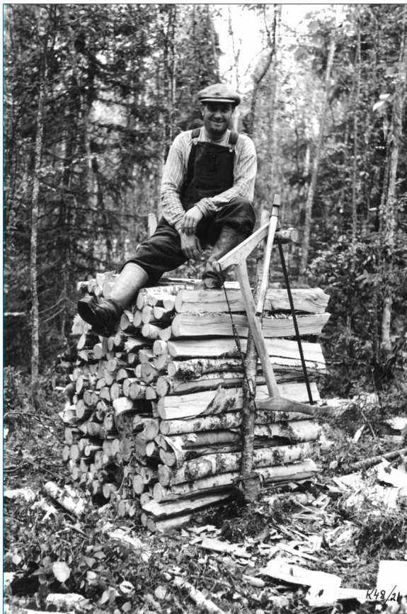
Kuvassa 2 on motintekijä saanut urakkansa valmiiksi.

Miesten jouduttua rintamalle oli puutetta ammattitaitoisesta metsätyövoimasta ja lisäksi ajokalustoa ja hevosiakin otettiin armeijan käyttöön. Vuonna 1940 todettiin, että seuraavalle talvikaudelle oli polttoainevarastoissa 10-12 milj. pinokuutiometrin vajaus. Sen korjaamiseksi annettiin vuonna 1940 halkolaki eli laki polttopuun saannin turvaamiseksi. Laissa annettiin metsänomistajille hakkuuvelvoite vetoimuksen muodossa eikä pakkohakkuuta tarvinnut aloittaa yksityismetsissä. Polttopuuvaje parantuikin 7 milj. pinokuutiometrillä kesän 1940 lopulle tultaessa. Keskusmetsäseura Tapio oli laatinut kesähakkuuohjelman, joka maastoutettiin metsänhoitoyhdistysten kautta tiloille. Puun hintaa säänneltiin Kansanhuolto-ministeriön toimesta.