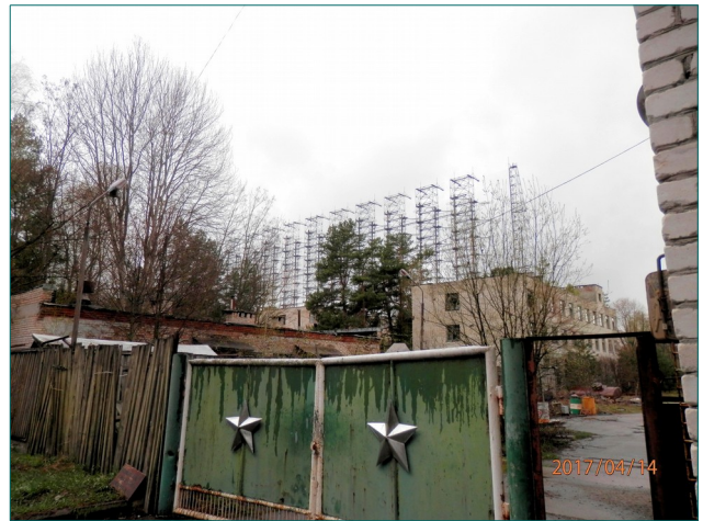
Tutka hävisi maastoon eikä tahtonut erottua edes asemanportilta.

Kun matkaan aamulla lähdettiin, opas kertoi, että ennen reaktorille menoa pysähdymme katsomassa, minkälainen rakennelma on aikanaan tarvittu vakoilutoimintaa varten. Hän kertoi myös, että järjestelmä oli piilotettu maastoon niin hyvin, että tästä ja alueen tiukasta vartioinnista johtuen tavalliset paikalliset ihmiset eivät tienneet järjestelmän olemassa olostakaan mitään. Tai eivät olleet tietävinään, kun niin oli parempi. Hupaisaa oli, että peitetarinaa vahvistettiin sillä, että alueen ohi kulkevan valtatie ja tutka-asemalle johtavan sivutien risteykseen oli rakennettu autopysäkki, jossa kerrottiin, että sivutie johtaa nuorten kesäleirille. Rakennelma teksteineen oli käydessämme edelleen paikallaan.