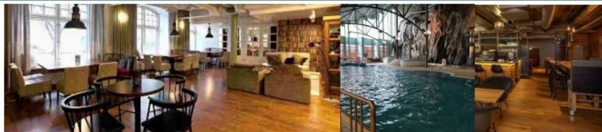
Sisäkuvia kokouspaikastamme.