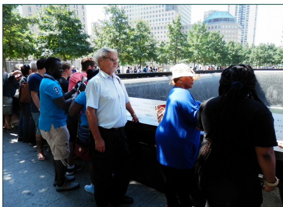
WTC surupuisto vetää hiljaiseksi.