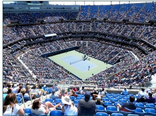
Suurin stadion. Tuskin näkee pelaajia, pallosta puhumattakaan.

Maanalainen lähti Manhattanin keskusasemalta ja alittaen välissä olevan salmen siirtyi Brooklynin, missä rata nousi maan pintaan jatkaen Queensiin. Juna pysähtyi aivan tenniskeskuksen pääportin eteen, joten ei muuta kuin ihmeellistä lankuista tehtyä siltaa pitkin itse areenalle. Amerikassa kaikki on suurta. niin täälläkin, aina lankkusillasta lähtien. Alue on iso, väkeä paljon, samoin myyntipisteitä erilaisille tuotteille niin, että rahansa saa varmasti menemään. Pääkenttä Arthur Ashe stadion, on luonnollisesti maailman suurin tennisareena. Kapasiteetti 23 000 katsojaa. Kakkoskentän Louis Armstrong stadionin kapasiteetti 14 000 katsojaa on saman verran kuin muiden Grand Slam kisapaikkojen pääkenttien. Ashe on afroamerikkalainen tennispelaaja ja kaikki jatsin ystävät tuntevat Satchmon.