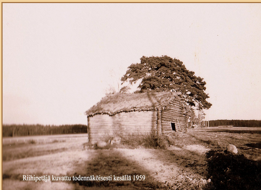
Riihipetäjä kuvattu todennäköisesti kesällä 1959

Ruuskanen-Ruuska sukuseuran sukuviesti 41 huhtikuu 2020