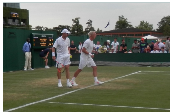
Henri Kontinen John Peers listaykköset