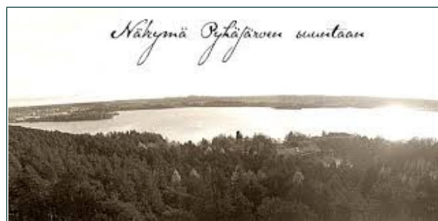
Pyynikki nostalgia/ Näköalatasanne (Pyhäjärvi) historia.tampere.fi

Lähteet: pyynikinkesateatteri.fi ja Wikipedia