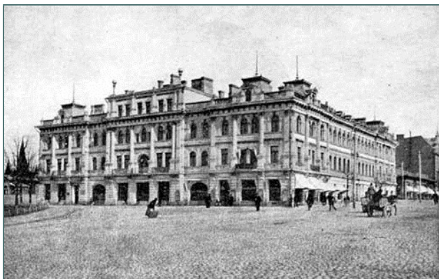
K P Ruuskanen Oy:n liiketalo Tampereella

väheni, kun taas kangasteollisuus tarvitsi materiaalia. Tämä liiketoiminta laajeni kangasteollisuudeksi ja pukinetehtaaksi Kallen jälkeläisten toimiessa yhtiön johdossa 1900-luvulla.