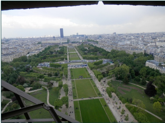
Näkymä 1. tasolta

Joten Pariisiin ja sen turistikohteisiin tutustumisenkaan ei oikein miltään osin onnistunut.