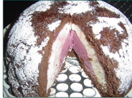
Valmis tuote, alkuperäistä en kerennyt maistamaan, kun tuomarit olivat syöneet kaiken, joten tein kotona uuden. Myös mansikkaversiona toimii hyvin