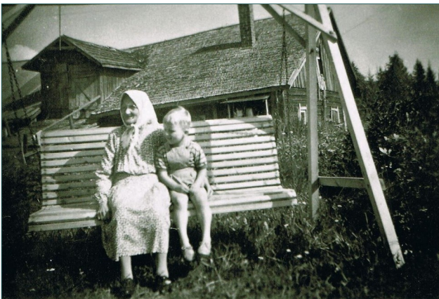
Navetan vintti heinävarastona

Karjasuojia eli navettoja uusittaessa niistä alettiin tehdä 1900-luvulla kaksikerroksisia ja yläkertaan tehtiin tilat heinän säilytystä varten. Navetan välikatossa olleen aukon läpi heinät oli helppo pudottaa suoraan karjan eteen pöydälle syötäväksi. Näiden tilojen käydessä pieniksi niiden lisäksi tehtiin myöhemmin lauta-rakenteisia heinävarastoja eli saraneita.