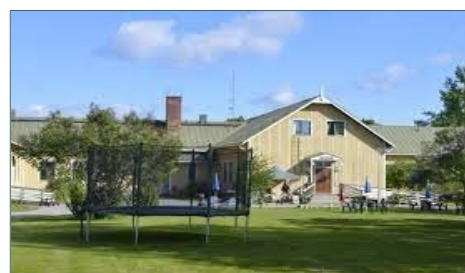
Aikon kartano. Kuva: booking.com