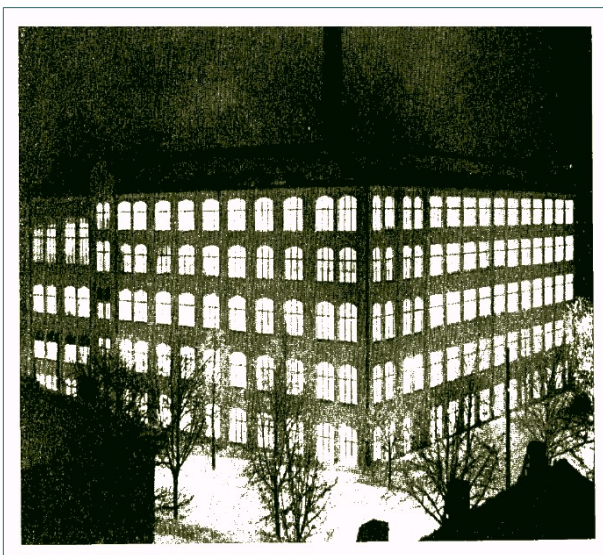
Sukkatehdas talvi-iltana 1930-luvun lopulla

Vuonna 1919 yhtiön omistajat päätyivät yksi toisensa jälkeen siihen, että yhtiön osakekanta myydään kilpailijalle Suomen Trikoo Oy:lle ja johtohenkilöt luopuivat tehtävistään yhtiön johdossa. Aluksi Kutomateollisuus osakeyhtiö pidettiin erillisenä yhtiönä Suomen Trikoon omistuksessa, mutta vuoden 1928 alusta Tampereen Kutomateollisuus Oy sulautettiin Suomen Trikoo Oy:hyn. Tehtaassa valmistettiin sukkiä 1920-luvulta alkaen. Sukkien valmistamiseen tarvittavia koneita hankittiin Englannista ja Amerikastakin saakka. Toisen maailmansodan aikana tehtaalla valmistettiin pääasiassa miesten sukkiä ja alusvaatteita armeijan tarpeisiin.