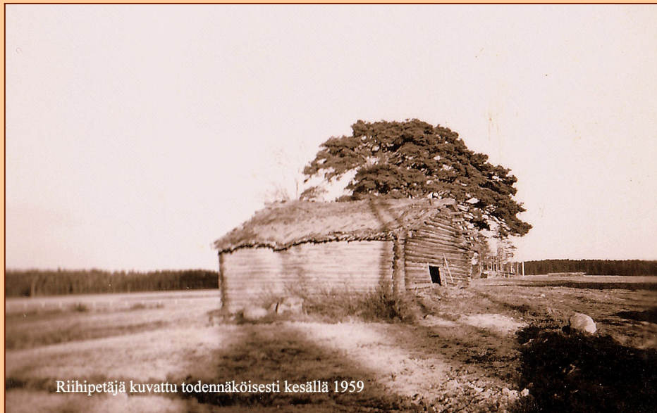
Riihipetäjä kuvattu todennäköisesti kesällä 1959

Ruuskanen-Ruuska sukuseuran sukuviesti 42 huhtikuu 2021