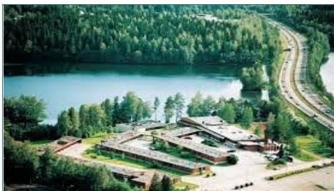
Hotelli Iso-Valkeinen.

Taseen loppusumma vuoden 2018 lopussa oli 2 921,22 euroa, vuoden 2019 lopussa 2 740,96 euroa ja vuoden 2020 lopussa 1 668,53 euroa. Pankkitilin saldo vuoden 2018 lopussa oli 2 921,22 euroa, vuoden 2019 lopussa 2 740,96 euroa ja vuoden 2020 lopussa 1 668,53 euroa. Sukukirjan painatuslaskun maksamiseksi sukuseuralla oli lyhytaikaista velkaa vuoden 2020 lopussa 700 euroa. Velka on maksettu pois vuoden 2021 maaliskuussa. Tuotot ja kulut ilmenevät tuloslaskelmasta ja pankkitilin saldo taseesta.