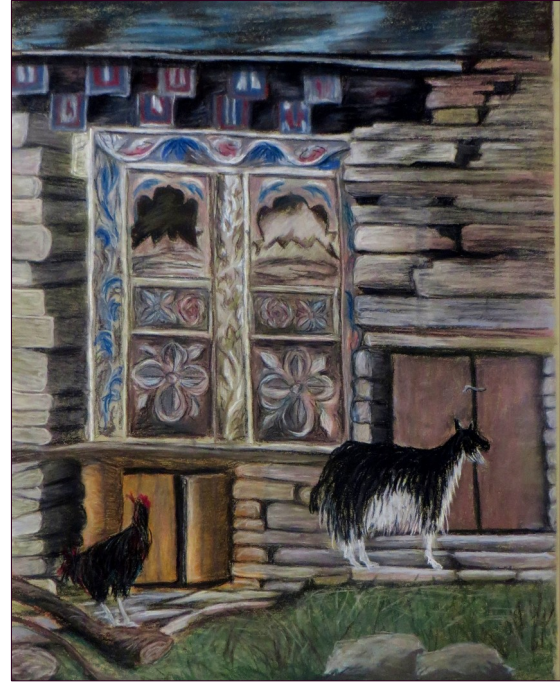
Toinen maalaukseni liittyy Manangiin. Aiheenaan kunnianosoitus vuoristokyläen ja – kaupunkien perinteiselle rakentamiselle, jossa taidokkaat, maalatut puuleikkaukset koristavat ikkuna- ja oviapieliä - sekä ihmisten ja eläinten yhteiselolle.

Useampi vuosi tässä ehtikin jo vierähtää. Vaatimustaso Annapurna Circuitille tuntui niin kovalta, että aloitin kunnollisen harjoittelun, joka ikävä kyllä karkasi käsistä. Onneksi olin päättänyt tehdä ensin harjotusreissun Kilimanjarolle. Se tosin meni myttyyn, koska olin treenannut itseni silmät kiiluen ylikuntoon ja unohtanut kokonaan levon merkityksen – kuntohan siinä sitten petti heti alkumetreillä. No ei hätää, tämä oli hyvä ja opettavainen kokemus tulevaisuutta silmälläpitäen. Niinpä sitten keväällä 2015 olin valmis Annapurna Circuitille.