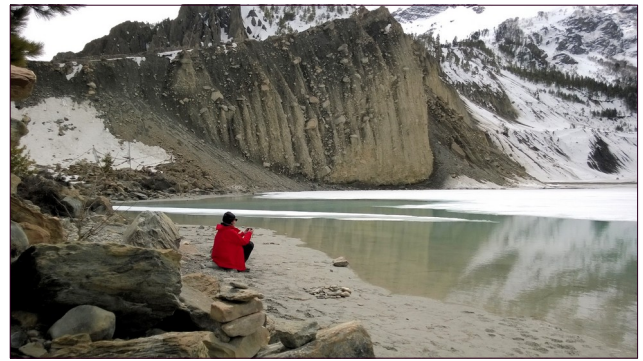
Vielä hetkeksi istahdimme suppajärven lumoihin ennen lounasta ja paluuta Manangiin, jossa osallistuimme vuoristotautiluentoön sekä herkuttelimme jakinjuustolla ja omenapiirakalla ennen illallista ja yöunia.

Aikamme kiertelimme Gagnapurnan kuvetta lumihangessa rämpien, vuoristomaisemia ihailien, Manangin vanhaa vuorenrintettä myötäilevää rakentamista hämmästellen ja oppaiden pitämiin vuoristo-oppitunteihin osallistuen.