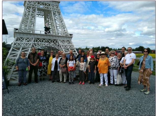
Matkalaiset Eiffelin tornin juurella