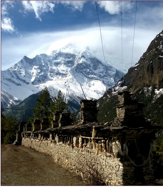
Pisangista lähtien Annapurna II vartioi tarkasti kulkuamme.

Seuraava etappimme oli alueen keskus Manang. Alkumatkan kuljimme ylä- ja alamäkeä kauniissa havumetsässä, missä petäjien takaa saattoi ilmestyä milloin Himalajan sinilammas, milloin jäätikön muovaama suppajärvi, mutta sitten alkoikin pitkä uuvuttava lähes kohtisuora nousu Ghyaruun , jossa pidimme teetaun. Teetaun jälkeen alkoi sade, joka pikkuhiljaa muuttui alati sakenevaksi lumisateeksi. Tuli tunne kuin olisimme hämyisissä Narnian metsissä kulkeneet vaitonaisina tuttua polkua alas jokilaaksoon Kivenhakkaajan sillalle. Sillalta sitten jatkaat matkaa läpi kääkkärämäntyjä kasvavan karun maahisten maan, jota vartioi toisella puolen veden ja jään muodostama rosokallio ja toisella puolen vuolas virta Marsyangdi Nadi. Ja siellä alhaalla asusteli yksikseen laakson kaunistus, Tiibetin punainen lintu. Ensimmäisen Himalajan korppikotkan kohtasimme pian Nawalissa vietetyn lounastauon jälkeen.