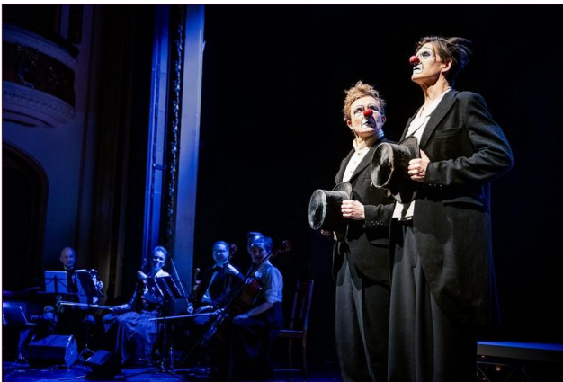
Kuva: Suomen Kansallisteatteri, Red Nose Company lavalla

Teatteriteos Aleksis Kivi – mies, josta tuli monumentti esittelee kansalliskirjailijamme elämän ja tuotannon häkellyttävän monipuolisesti. Esitys on enemmän kuin taidetta: sen tarjoilemat ahaa-elämykset, pitkien jatkumoiden ja ajankohtaisten ilmiöiden yhdisteleminen ovat myös korkeatasoisen tiedonjulkistamisen tunnusmerkkejä.