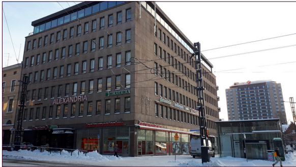
Suomen Pankin talossa oli Soltam yhtiön toimisto.