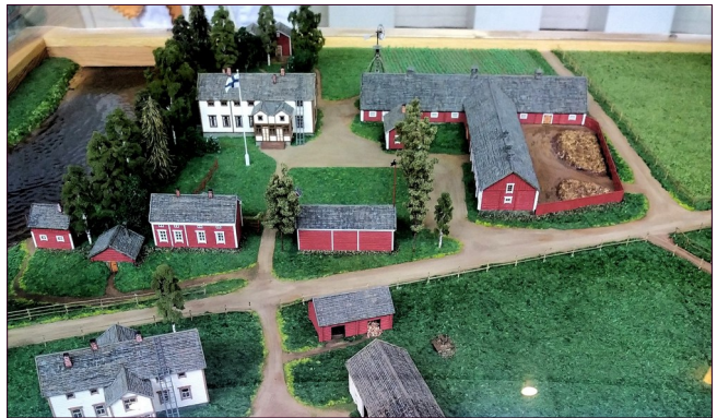
Kallion tilan Heikkilän pienoismallirakennelma

museo. Talo ei ollut Kallion asuintalo Heikkilä, vaan erikseen museoksi rakennettu. Lasivitrinissä oli Kallion tilan Heikkilän pienoisorakennelma kuvaten tilaa vuodelta 1939. Aulassa oli esitetty Kallion aikaisia maatyökaluja ja osaa keittiön huonekalustuksesta. Erillinen huone oli Presidentti Kallion työhuone, jossa pöytien ja tuolien puukoristeveistokset herätti kyllä kunnioitusta taitavan puusepän taidoista. Samoin kävijän arvostuksen ansaitsivat historialliset lakikokoelmat. Alakerran toisessa huoneessa olivat nähtävänä presidentin kunniamerkit.