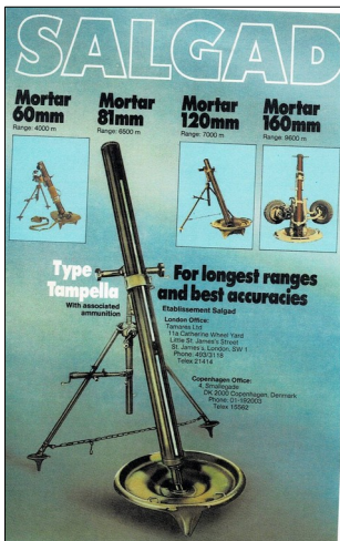
Type Tampella merkillä Salgad-yhtiö myi kranaatinheittimiä v. 1984

Tampellan asekaupat olivat lehdistössä esillä ja poliitikkojen käsittelyssä moneen kertaan 1970-luvulla. Vuonna 1974 Tampellan ja israelilaisten yhteistyö päätettiin lopettaa sopimuksella, jonka mukaan yhteistyö siirtymäajan jälkeen päättyi v. 1976. Tampellalle jäi kotimaiset tilaukset ja Salgad sai provisiot ulkomaisista toimituksista. Ulkomaiset asepatentit luovutettiin Salgadille. Tampella oli talousvaikeuksissa jo 1970-luvun lopulla ja päättyi lopulta konkurssiin 1990-luvun alussa. Kallioporakoneita valmistava yhtiön osa toimii edelleen Tamrock-nimisenä ja sen omistaa ruotsalainen Sandvik.