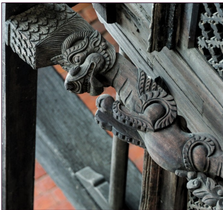
Eräs esimerkki taidokkaista puukaiveruksista

Matkalla Pokharaan piipahdimme 1950-luvulla perustettussa tiibetiläisten pakolaisleirissä. Pokharassa hyvästelimme ihanat kantajaoppaamme sekä taitavan kuskimme, kävimme Phewa-järvellä soutelemassa ja oluita nauttimassa lämpimässä auringonpaisteessa. Pokharan kentällä sain viimeisen vuoristotuntemusoppitunnin ennen koneeseen nousua. Kathmandussa hyvästelimme sitten iki-ihanan oppaamme ja tutustustuimme kaupungissa olevista Unescon maailmanperintökohteista Pasupatinathin tempelialueeseen, Bubbhanatin stubaan, Patanin Durbar Squareen (kuninkaallinen palatsialue) ja Swayambhunathin stubaan. Mielenkiintoinen oli reissumme juhlaillallinen Dwarikas hotellissa , joka on tunnettu ponnisteluistaan nepalilaisen kulttuurin säilyttämiseksi.