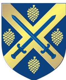
Ruuskanen-Ruuska sukuseura ry

Viime syksystä lähtien on voinut lähettää kirjeitä ja kortteja sukuseuran postimerkillä varustettuna. Syksyn alkupuolella (nro 14) oli ohjeet postimerkin tilaamista varten. Mikäli lehti on kadonnut, on tilausohjeet tässä uudestaan. Myöhemmin maaliskuun loppupuolella ne löytyvät sukuseuran uusilta kotisivuilta, jotka ovat parast'aikaa työn alla.