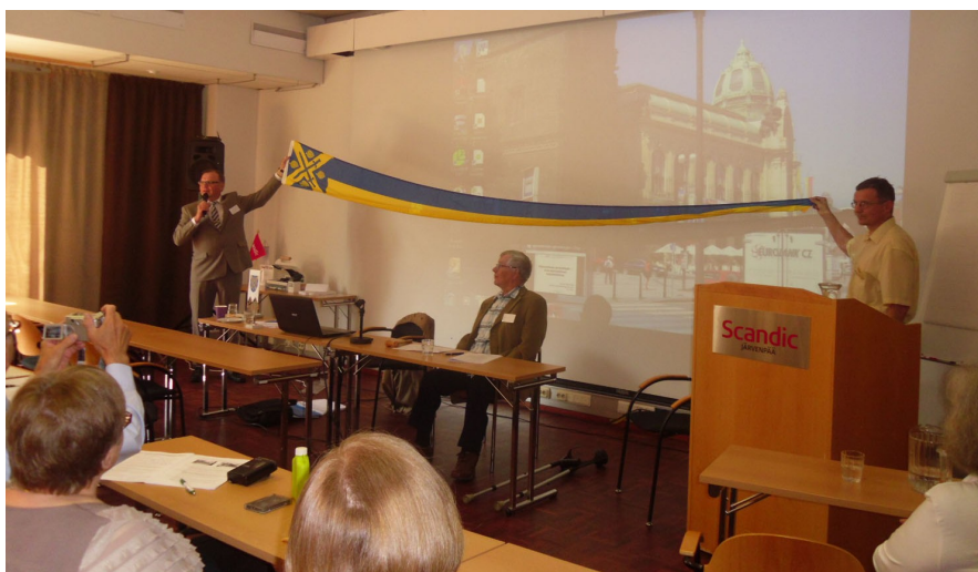
Sukuviirin paljastaminen 4.08.2012