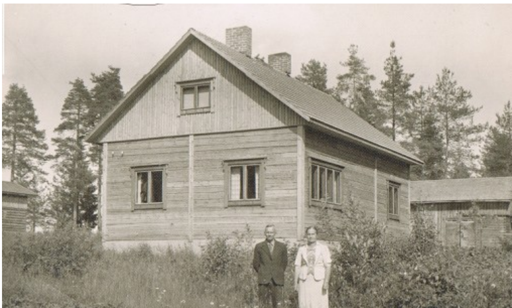
Välirauha Ihalassa on äidin puoleisen isotätini talo Lumivaaran Ihalassa. Talo on tänäkin päivänä pystyssä.

vanhoilla asuinsijoillaan oli jo 70 %. Jatkosodan aikana ennätettiin jo rakentaa uusiakin asuintaloja Karjalaan.