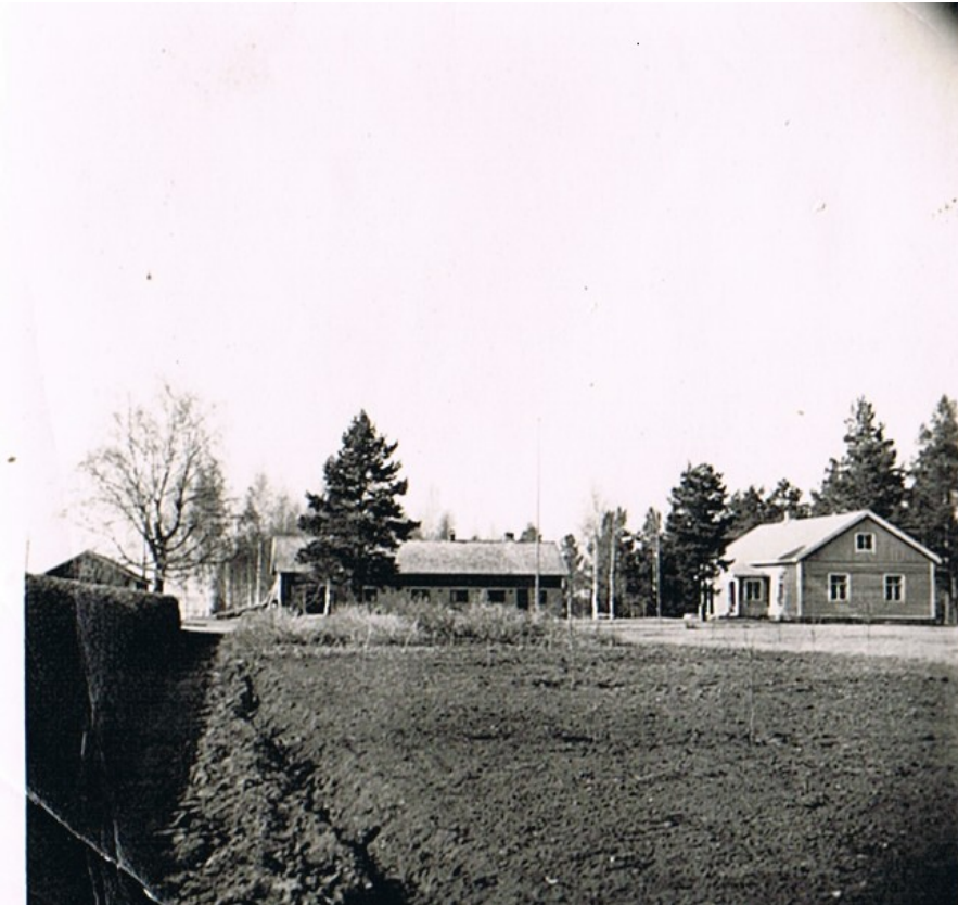
Siirtolaistalo on tyypillinen evakkojen tekemä talouskeskus.

kerroksinen ulkokuistilla varustettu talo. Navettarakennuksessa oli saman katon alle sijoitettu karjasuojan lisäksi karjakeittiö, maitohuone, hevostalli, rehuvarasto ja kalustusuoja. Sementti- ja punatiili olivat tyypillisiä navettarakennuksen rakennusmateriaaleja. Työpäivät asutustiloilla kuluivat raivauksen ja rakentamisen parissa normaalien maataloustöiden lisäksi. (Laitinen 120-131).