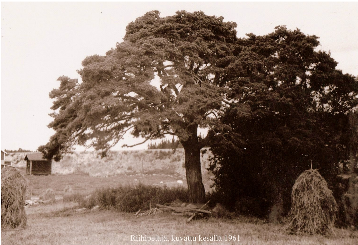
Riihipetäjä, kuvattu kesällä 1961