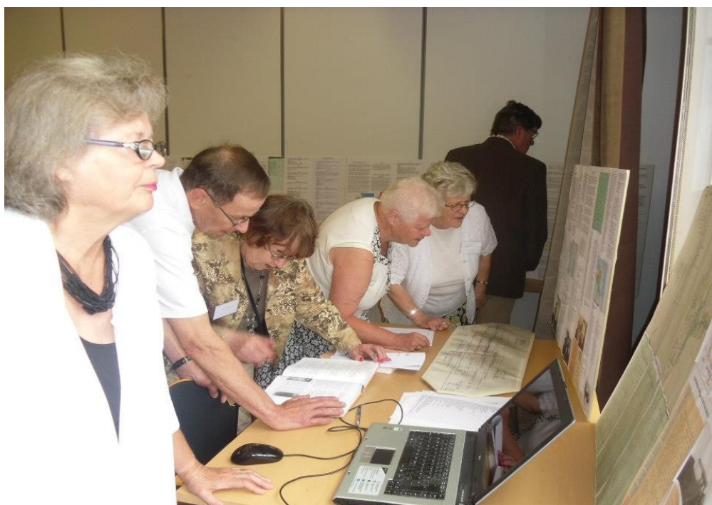
Kuvat Iris Humala