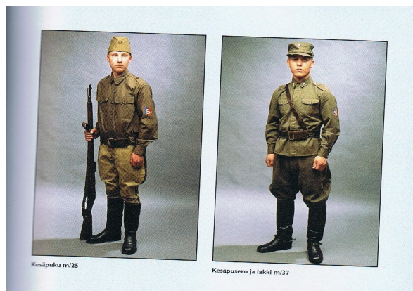
Kuva teoksesta Sarkatakkien armeija; Suojeluskuntapuvut Kesäpuku m/25, ja kesäpusero ja lakki m/37

Tilanteen rauhoituttua perustettiin Helsingissä poliisin avuksi suojeluskunta, jolle valtuusto myönsi määrärahat ja kuvernööri vahvisti suojeluskunnan säännöt. Myös punakaartien toiminta jatkui ensin sosiaalidemokraattien johtamana ja myöhemmin johto siirtyi vallankumouksellisesti ajattelevien haltuun. Kummankin kaartin toiminta-ajatus oli yhtenevä: suojata ihmisten henkeä ja omaisuutta sekä kansalaisvapauksien toteutumista. Punakaartien jäsenmäärä nousi arvion mukaan 25 000 henkeen. Helsingissä oli kahakoita Hakaniemessä ja Viaporissa ja näihin osallistui kummankin kaartin jäseniä. Kahakoiden johdosta Helsingin suojeluskunta hajaantui ja punakaarti lakkautettiin. (Selén: Sarkatakkien maa, s. 11-13)