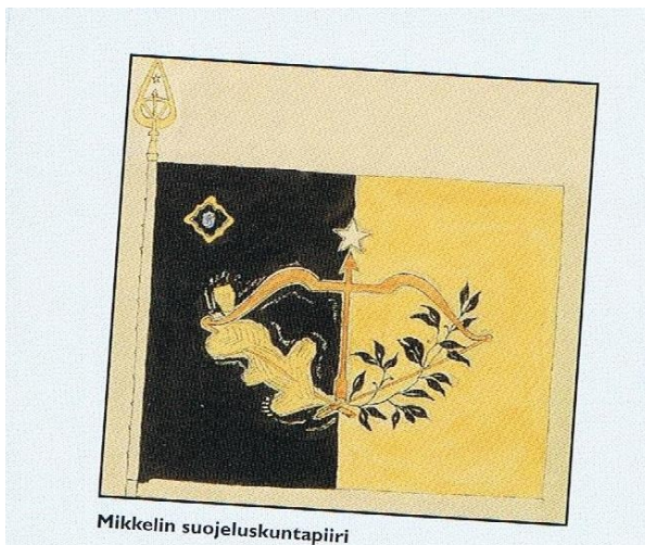
Kuva teoksesta Sarkatakkien armeija; Mikkelin suojeluskuntapiirin lippu