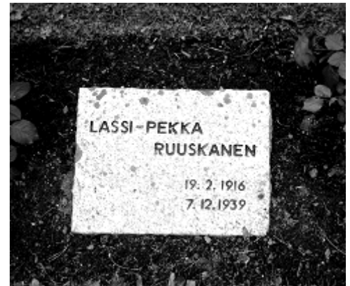
Lassi-Pekka Ruuskasen sankarihauta on Siilinjärven sankarihautausmaalla.

Vieta janan tähän ki- fesson oman tuntelevyn numeron 763791 jonka perus- teella mies tunnetaan jos ei oma suu jaksa sanoa 763791 Ties tällä numerolla loy- tyy jos niin käy? 763791 Tervehtien Lassi 3.12.39 Terveiset veli pojilta