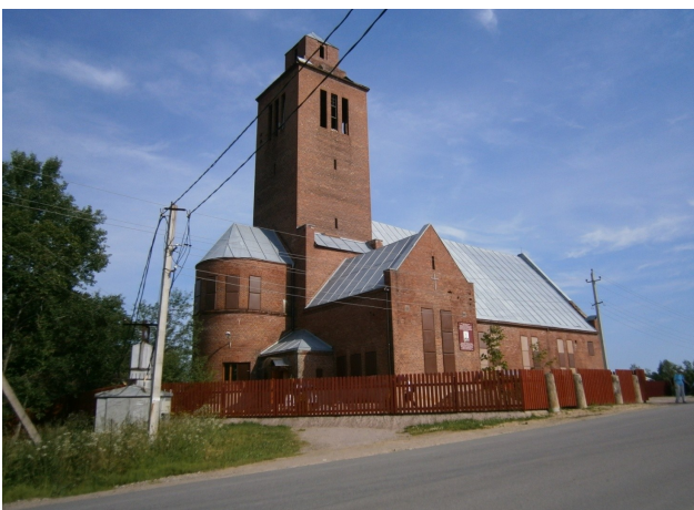
Kaukolan v.1933 valmistunut kirkko. Nyt v. 2012 aidattu, sekä pellit ovissa ja ikkunoissa. Kirkon nykyinen nimi Johannes Kastajan Kappeli. Entisen kellotapulin ikkunat vielä ilman peltiä.