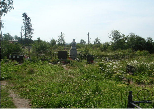
Kaukolan hautausmaa vuoden 2011 Asta -myrskyn jäljiltä.