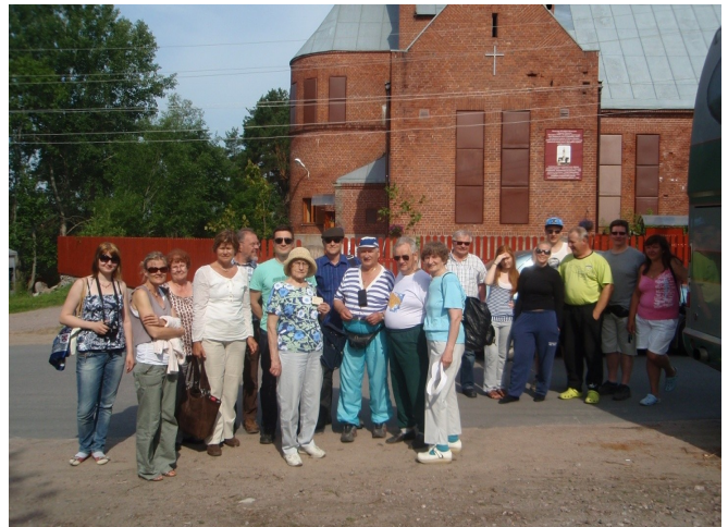
Osa matkalaisista Jokeloita 3, Vartiaisia 5, Ruuskalaisia 10.