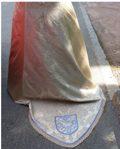
Vaakuna kirjailtuna laahukseen

Pari vihittiin 28.6.2013 ja sukuseura sai valokuvia tuosta mielenkiintoisesta hääpuvusta