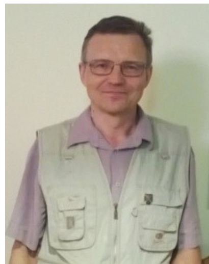
Pinssin onnellinen omistaja

Sukuseuran hallituksen kokouksessa 10.08.2013 julkistettiin pinssi, jossa kuva-aiheena on myöskin sukuseuran vaakuna.